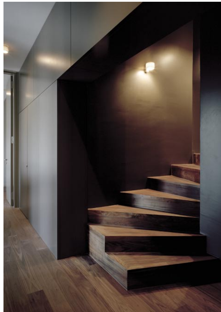
Alle Böden sowie die Treppe sind aus Nussbaumholz. Sämtliche Schrankeneinbauten und Türen wurden dunkelgrau gestrichen. Der Farbton stammt von einer Corbusier-Palette von KT Color. Leuchte: Serien