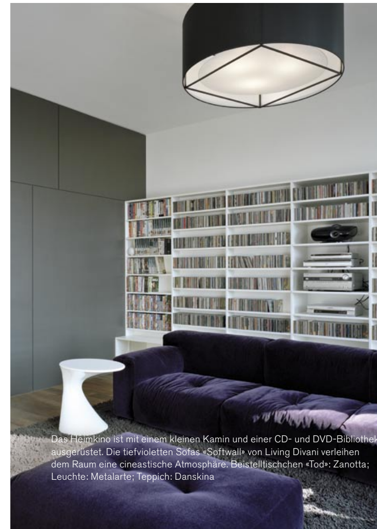
Das Heimkino ist mit einem kleinen Kamin und einer CD- und DVD-Bibliothek ausgerüstet. Die tiefvioletten Sofas «Softwall» von Living Divani verleihen dem Raum eine cineastische Atmosphäre. Beistelltischchen «Tod»: Zanotta; Leuchte: Metalarte; Teppich: Danskina