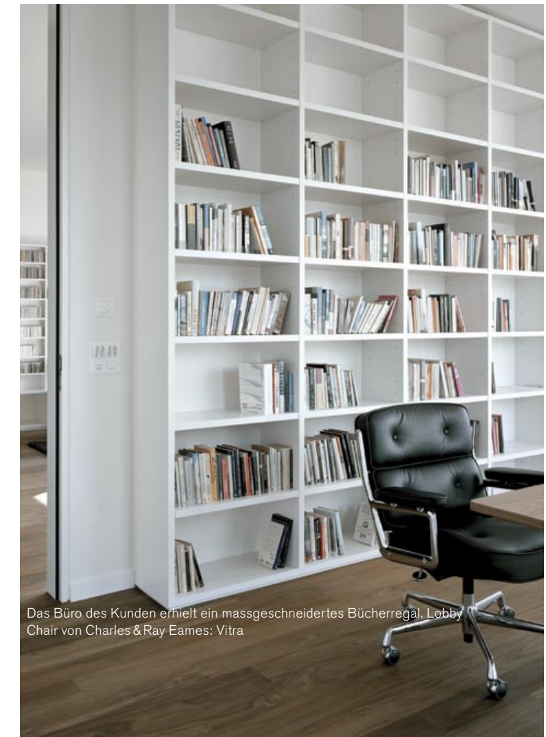
Das Büro des Kunden erhielt ein massgeschneidertes Bücherregal. Lobby Chair von Charles & Ray Eames: Vitra